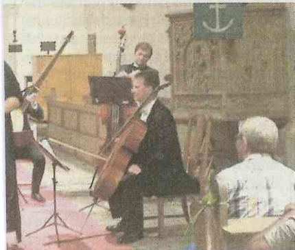
e Kammerphilharmonie Köln.